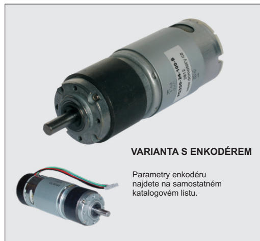
VARIANTA S ENKODÉREM

Parametry enkodéru najdete na samostatném katalogovém listu.